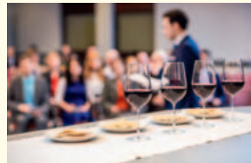
Gottesdienst am wichtigsten Feiertag von Jehovas Zeugen

Am Freitag, den 15. April 2022 gedenken Jehovas Zeugen auf der ganzen Welt des Todes Jesu. Jeder in der Region Saarland ist eingeladen, an diesem besonderen Gottesdienst kostenlos teilzunehmen. Jedes Jahr, gedenken Jehovas Zeugen auf der ganzen Welt des Todes Jesu. Das tun sie gemäß dem Vorbild der ersten Christen genau an dem Abend, an dem Jesus mit seinen Aposteln das Passah feierte. Es ging in die Geschichte als „das letzte Abendmahl“ ein. Im Mittelpunkt dieses besonderen Gedenkgottesdienstes am Freitag, den 15. April 2022 um 20:15 Uhr steht die Dankbarkeit für das Leben und Sterben Jesu und was das für jeden einzelnen Menschen bedeutet. Im vergangenen Jahr nahmen weltweit über 21,3 Millionen Besucher an dieser denkwürdigen Feier digital teil. In Völklingen laden Jehovas Zeugen in den nächsten Tagen und Wochen viele Einwohner per