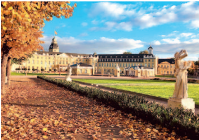
Das Karlsruher Schloss ist eines von vielen Highlights in der badischen Fächerstadt.

Auf der neuen Feinschmeckertour „Eat the World“ durch das lebhaftes Multi-Kulti-Viertel mit wunderschönen Gebäuden aus der Jugendstil- und Gründerzeit wird an verschiedenen kulinarischen Stationen halt gemacht. Daneben erfahren Teilnehmer auf dem Rundgang Interessantes über den Stadtteil und seine Bewohner.