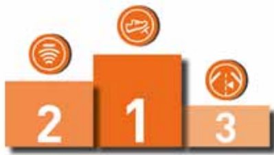
Quelle: Umfrage der Kampagne „Bester Beifahrer“ des Deutschen Verkehrssicherheitsrates und Partner. Forum unter 1.000 Neuwagenkäufern, März 2021

3. Spurwechselassistent, auch Totwinkelassistent genannt: Er warnt vor Fahrzeugen auf der anderen Spur, auch wenn sie schnell herannahen und sich im toten Winkel befinden. Wird der Blinker gesetzt, obwohl sich ein Fahrzeug auf der Nebenspur befindet oder sich nähert, warnt das System.