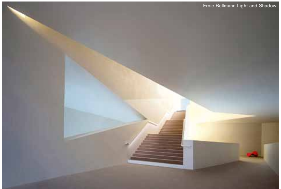
Ernie Bellmann Light and Shadow