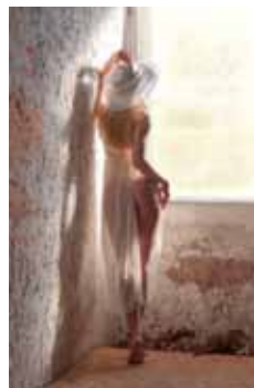
Brausch Heidi am Fenster

Auch bei den Völklinger Autor*innen war die Motivwahl breit gefächert. Insgesamt nahmen 96 Fotografinnen und Fotografen mit 576 Bildern an der Meisterschaft teil. Erfolgreichste Teilnehmer für den Fotoclub