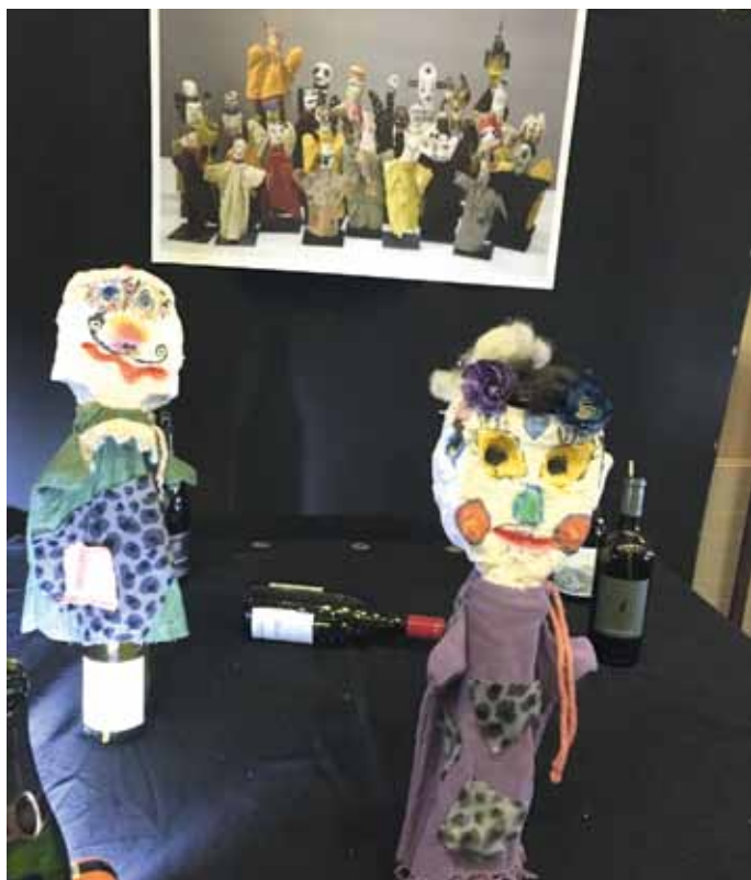
Bauhauskunst – Kassiopeia Projekt 2019