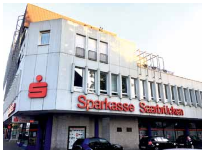
Fototext: Sparkasse Bismarckstraße

„Wir haben auf die Zusage der Sparkasse Saarbrücken vertraut, nach der Fusion mit der Stadtparkasse Völklingen keine weiteren Filialen zu schließen - das war ein Fehler!“, gibt Erik Roskothen, stellvertretender Fraktionsvorsitzender der SPD im Stadtrat, zu. Auf Antrag der SPD hat die Verwaltung eine Resolution gegen die aktuell geplanten Filialschließungen in Völklingen in die Ratssitzung am 10. September eingebracht. Mit vier betroffenen Filialen ist Völklingen überdurchschnittlich von den Konsolidierungsmaßnahmen betroffen. Es wäre die Pflicht der öffentlich-rechtlichen Sparkasse gewesen, vor solchen gravierenden Maßnahmen mit ihren Trägern – den Kommunen – das Gespräch zu suchen und Lösungen für die betroffenen Standorte zu finden. Die SPD Fraktion fordert die Sparkasse auf, eine echte Zukunftsperspektive zu entwickeln. Keine Zukunftsvision eines scheidenden Vorstandschefs, wie sie aktuell vorliegt. Es müssen klare Konzepte für die Versorgung des ländlichen und Siedlungsraumes von Völklingen her. Die vorgelegte Resolution wurde einstimmig verabschiedet. Resolution im Internet: http://spdvk.de/c3