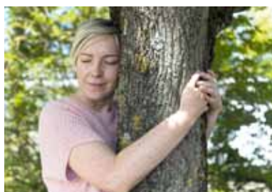
Mein Baum - mein Schatz!

Eine Foto-Text-Aktion zur Ausstellung „Mon Trésor – Europas Schatz im Saarland“, zu erleben ab 12. September 2020 im Weltkulturerbe Völklinger Hütte