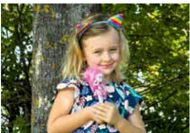
Meine Puppe - mein Schatz!

an alle SaarländerInnen sowie BewohnerInnen unserer europäischen Großregion. Zeigen Sie uns Ihren Schatz! Das kann Ihr Lieblingsbaum im Garten sein, eine alte Fotografie, die Taschenuhr des Großvaters, Ihr Kaninchen oder ein Mensch, der Ihnen lieb und teuer ist. Wir bitten Sie herzlich: Senden Sie uns ein Foto, das Sie mit Ihrem Schatz zeigt! Erzählen Sie uns die Geschichte dieses Schatzes. Und werden Sie so Teil der Ausstellung „Mon Trésor“ im Weltkulturerbe Völklinger Hütte. Unter allen Schatzsuchern und -finderInnen verlosen wir Freikarten in das Weltkulturerbe Völklinger Hütte und das Katalogbuch zu „Mon Trésor“. So geht es: Laden Sie einfach Ihr Foto mit Ihrem Schatz und dessen Geschichte auf unserer Internet-Plattform www.mon-tresor.org hoch. Und zeigen Sie uns damit, was Ihnen wirklich wichtig ist!