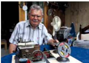
Mein Schatz! Die Dampfmaschine ist ein Erbstück meines alten Volksschullehrers – damals ein unerfüllbarer Jugendtraum!