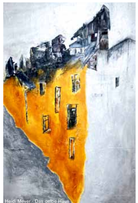
Heidi Meyer - Das gelbe Haus

Die derzeitige Ausstellung wird im Alten Rathaus bis zum 28. Februar zu sehen sein. Kontakt: VHS Völklingen, Telefon: 06898 / 13 25 97.