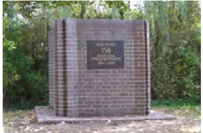
Russendenkmal Bürgerpark

russ. Kriegsgefangenen zu Tode kamen? 5. Wo befand sich das Lager, in dem bis zu 1.000 Russen gefangen gehalten wurden? Sofern es noch Zeitzeugen bzw. Nachkommen gibt, die über die Behandlung und die Lebensbedingungen der Kriegsgefangenen im 1. Weltkrieg in Völklingen Auskunft geben können, bitten wir um ihre Mithilfe. Dies unter E-Mail Adresse: russendenkmal@yahoo.de