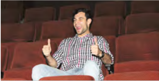
Ein Mitglied der Initiative voller Zuversicht

Heute hat sich die Initiative zur Wiederbelebung und Rettung des Völklinger Residenzkinos in der Immobilie der Familie Theis getroffen, um sich mit neuen Mitstreitern auszutauschen und das weitere Vorgehen zu planen. Begeistert waren alle nach ihrem Rundgang durch das Gebäude. Die Größe und das Flair des in den 50er-Jahren errichteten Kinos begeistern bis heute, auch ohne flimmernde Leinwände. Die einhellige Meinung: In diesem Gebäude steckt definitiv Potenzial! Um dieses Potenzial wieder zum Leben zu erwecken, hat sich die Initiative entschlossen, einen Verein zu gründen. Deswegen wird nun eine Satzung erarbeitet und schon bald eine Gründungsversammlung durchgeführt, der Termin steht allerdings noch nicht fest. Wer noch nicht dabei ist, kann sich gerne mit der Initiative in Verbindung setzen: Telefon: 0681 40 35 98 99 (Oliver Allard) oder 06898 22 77 4 (Andreas Hell). Per Email: kino(at)voelklingen-saar.de. Facebook: http://kuerzer.de/66333