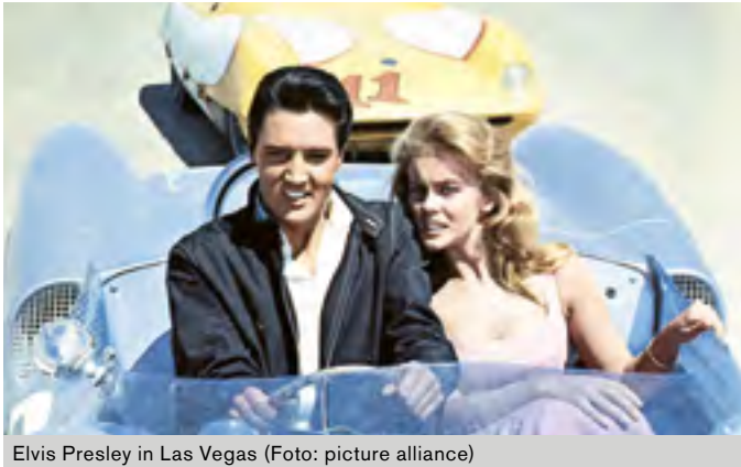
Elvis Presley in Las Vegas

Pop ist faszinierend und vielfältig. Pop, das sind die bahnbrechenden Erfindungen und unvorstellbaren Umbrüche der Gegenwart. Pop, das ist Kommunikation und Neuverortung. Pop, das ist die Neuerfindung des modernen Menschen und die Generation Pop