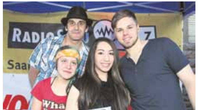
Foto: Die Gewinner 2011

Die Stadt Völklingen und McDonald's starten im Rahmen des Saarfestes einen großen Gesangs-Wettbewerb für die Talente von Morgen. Bereits zum vierten Mal bietet das Saarfest Sängerinnen und Sängern die Möglichkeit, sich auf der RADIO SALÜ-Bühne vor großem Publikum und einer ausgewählten Jury zu präsentieren.