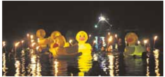
Foto-Beschreibung: „Fackelschwimmen, Saarfest 2010“

Vom 15. bis zum 17.Juni findet in Völklingen das Saarfest statt. Im letzten Jahr kamen insgesamt über 70.000 Besucherinnen und Besucher. Einer der Höhepunkte an diesem Wochenende wird das traditionelle Fackelschwimmen mit den Lampion-Kanufahrten auf der Saar sein.